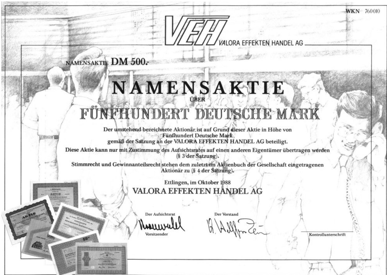
Abbildung der ehemaligen vink. Namensaktie der VEH AG