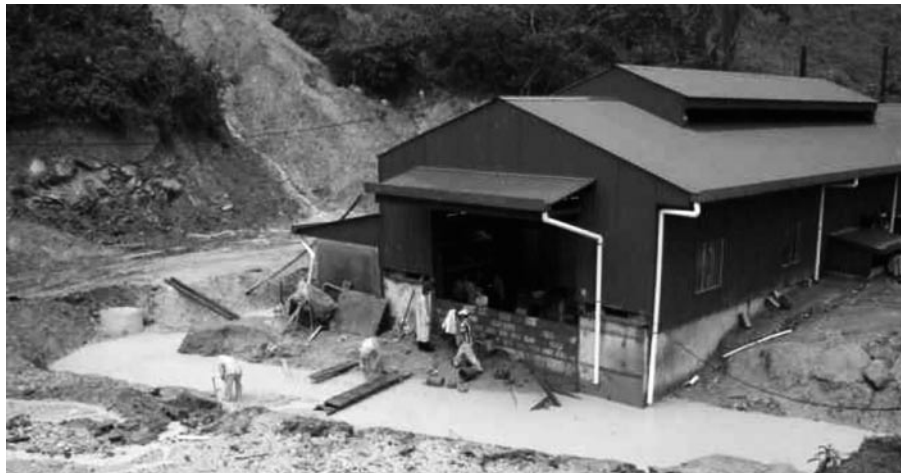
Zwei Mal überfluteten Wassermassen das vom Kunden zu nah am Fluss errichtete Krafthaus der WKV-Anlage in La Gloria/Honduras.