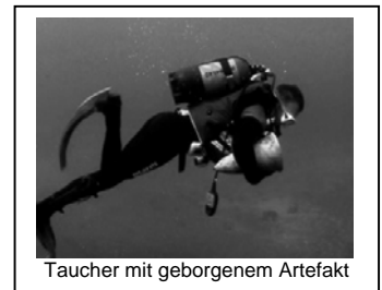
Taucher mit geborgenem Artefakt

Die ARQUEONAUTAS, gegründet 1995 auf Madeira / Portugal, betätigt sich in der kommerziellen, maritimen Archäologie und der Bergung von Artefakten aus Schiffswracks nach anerkannten wissenschaftlichen Grundsätzen. Das Unternehmen konzentriert sich hierbei nicht auf die Bergung einzelner Schiffe, sondern erwirbt Lizenzen in geographischen Gebieten, in denen eine Vielzahl werthaltiger Wracks durch historische Archivrecherchen dokumentiert werden konnten. Angesprochen werden politisch zuverlässige Regierungen, die Exklusivrechte für die Suche, Bergung und Verwertung